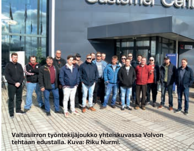
Valtasiirron työntekijäjoukko yhteiskuvassa Volvon tehtaalla edustalla.